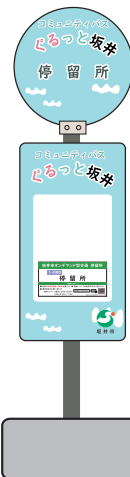
ゴミバス停タイプ